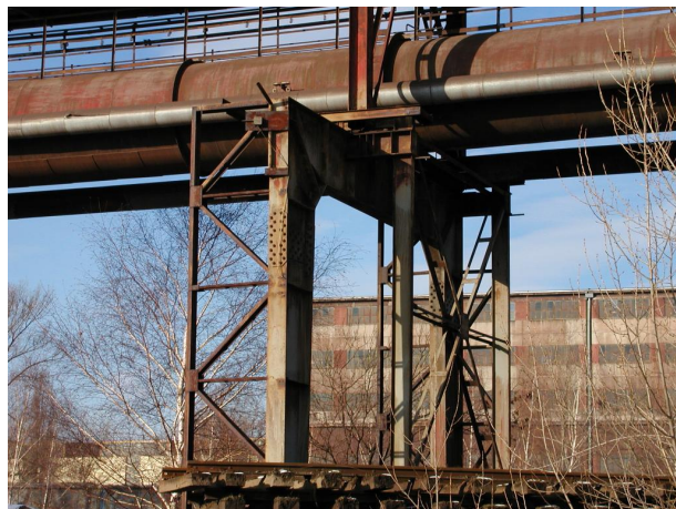
most B-C s potrubím koksového plynu a parovodem