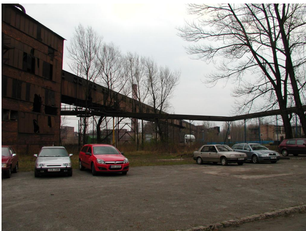
most B-C ústící do PS B