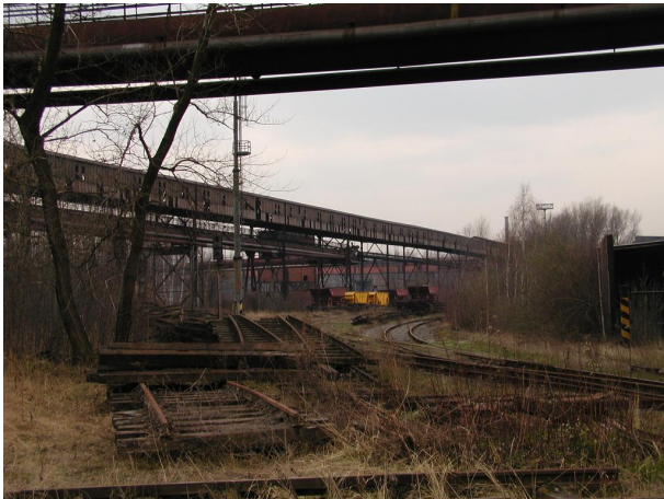
pohled na most B-C z homoskládky