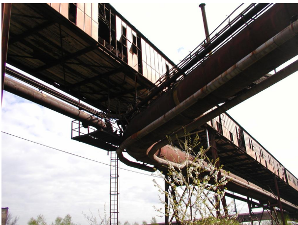
most B-C s potrubím koksového plynu a parovodem